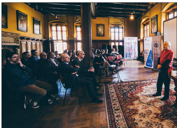
Fot. 1 Finał II. „Konkursu Antropologicznego”

pracy w terenie (np. czym jest obserwacja uczestnicząca) oraz tego, w jaki sposób wykorzystywane są badania antropologiczne w biznesie (np. pytanie związane z udoskonaleniem sposobów korzystania z kserokopiarki). Nie zabrakło również pytań z zakresu polskiej kultury współczesnej (np. czy koronkowe stringi można uznać za sztukę ludową?). Dłuższa forma wypowiedzi polegała na opisanu kompetencji jakie powinien mieć antropolog i wyrażeniu swojej opinii na temat tego, czy antropolog może pracować jako specjalista np. w marketingu lub reklamie.